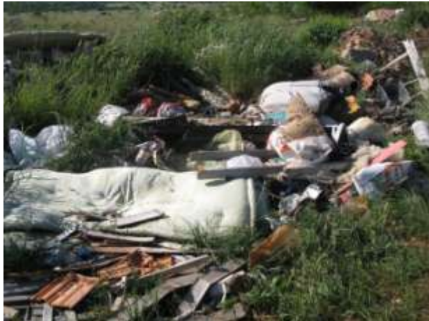
Najveće divlje odlagalište nalazi se u Ružiću - Midenjak